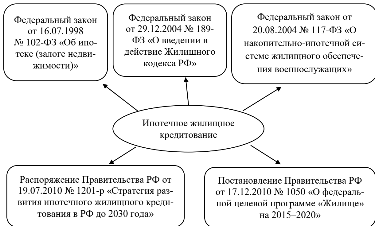
Рис. 1.2. Законодательная и нормативная база регулирования ИЖК*